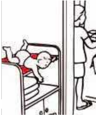
Sturz vom Wickeltisch